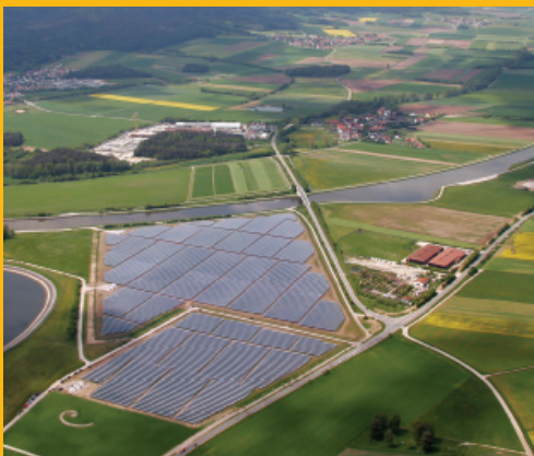
Bavaria Solar Park - 10 MW - Bavaria, Germania

Il telaio in acciaio galvanizzato resistente alla corrosione fornisce una maggiore resistenza